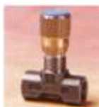
FT2251/2 - 01