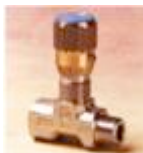
FT2251/2 - 02