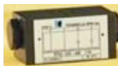
FT3 - CO

Válvulas de control unidireccionales con pilotaje presión hidráulico