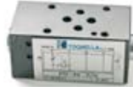
FT3 - PC - P

Válvulas antirretorno de apertura pilotada – simple 292