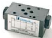
FT3 - CP

Válvulas de control unidireccionales con pilotaje presión hidráulico